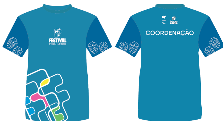
*Imagens meramente ilustrativas