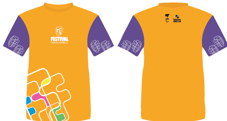
*Imagens meramente ilustrativas